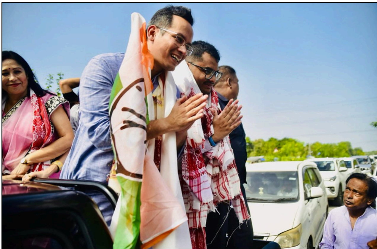
ভোট বিচাৰি! চামগুৰিত কংগ্ৰেছ প্ৰাৰ্থী হৈ প্ৰচাৰ সাংসদ গৌৰ গগৈৰ