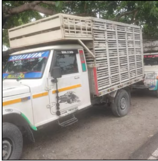
জনস্বাস্থ্যলৈ ভাবুকি! অসমলৈ সৰববাহ বংগৰ ব্ৰহ্মলাৰ

কৰিব। হোটেল লিলিত আজি বিয়লি অনুষ্ঠিত বৈঠকৰ পিছত এক সংবাদমেলযোগে এই মন্তব্য শেষাংশ ৪ পৃষ্ঠাত